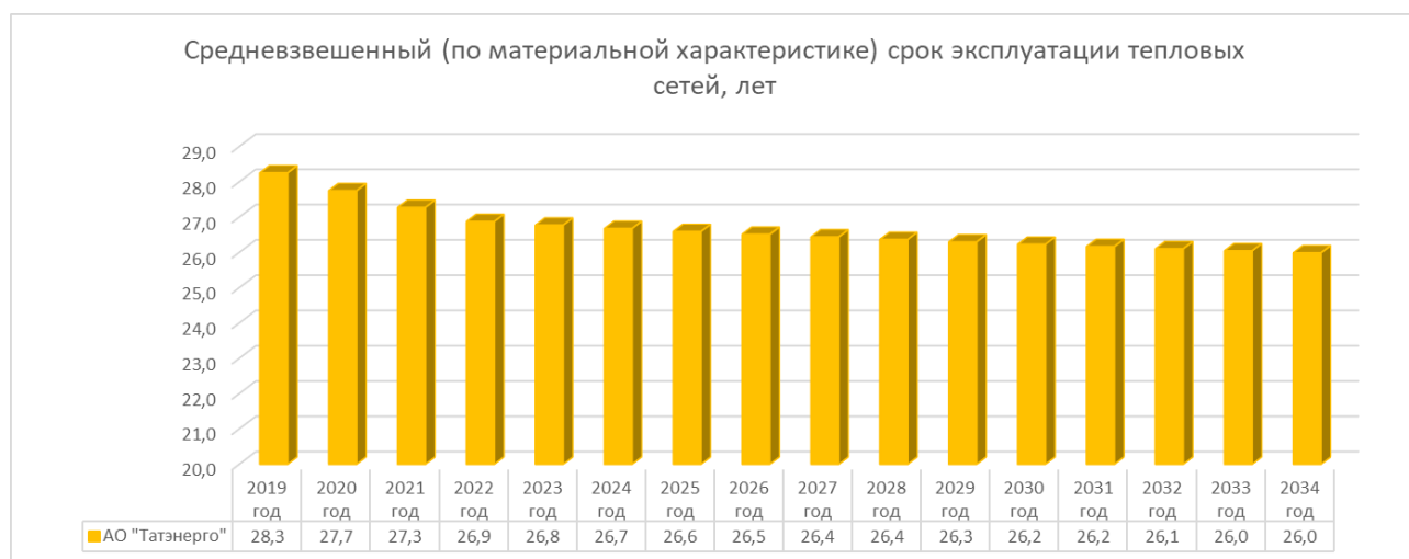
Рис. 1.2 Средневзвешенный (по материальной характеристике) срок эксплуатации тепловых сетей филиала АО «Татэнерго» «Нижекамские тепловые сети»

постепенно темпы обновления сетей снижаются, и средневзвешенный срок эксплуатации поддерживается на достигнутом уровне (см. Рис. 1.2).